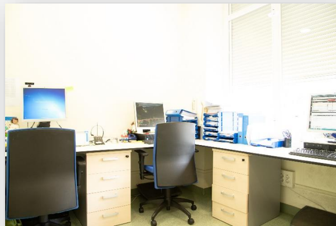
Planta Baja (Antiguas Consultas Urología)

Área para pacientes: 1 sillón reclinable, lavabo, báscula, carro de enfermería, electrocardiógrafo, esfigomanómetro, termómetro